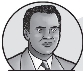
Nelson Estupiñán Bass