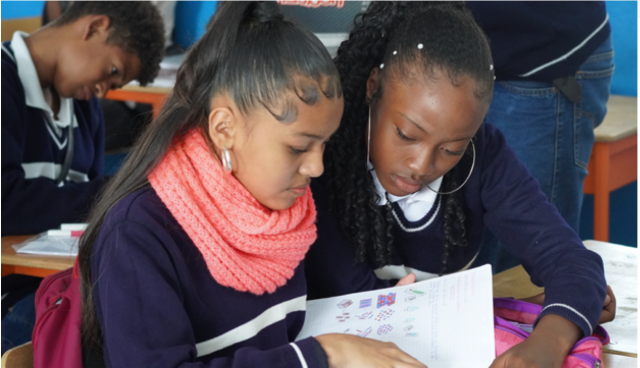
Estudiantes de la Unidad Educativa Guardianas de los Saberes Salinas, parroquia Salinas cantón Ibarra – provincia de Imbabura.

Las instituciones educativas del Sistema de Educación Intercultural podrán ser reconocidas como Guardianas de los Saberes, con el cumplimiento de las siguientes fases: