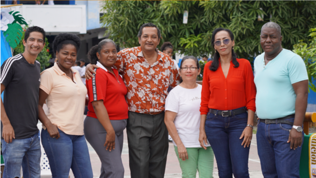
Docentes, Unidad Educativa Guardianas de los Saberes Fausto Molina , ciudad de Esmeraldas.

El Ministerio de Educación y la SEIBE coordinará la conformación de una planta directiva, docente y DECE con conocimientos sobre Etnoeducación Afroecuatoriana y su modelo, de acuerdo con el siguiente perfil: