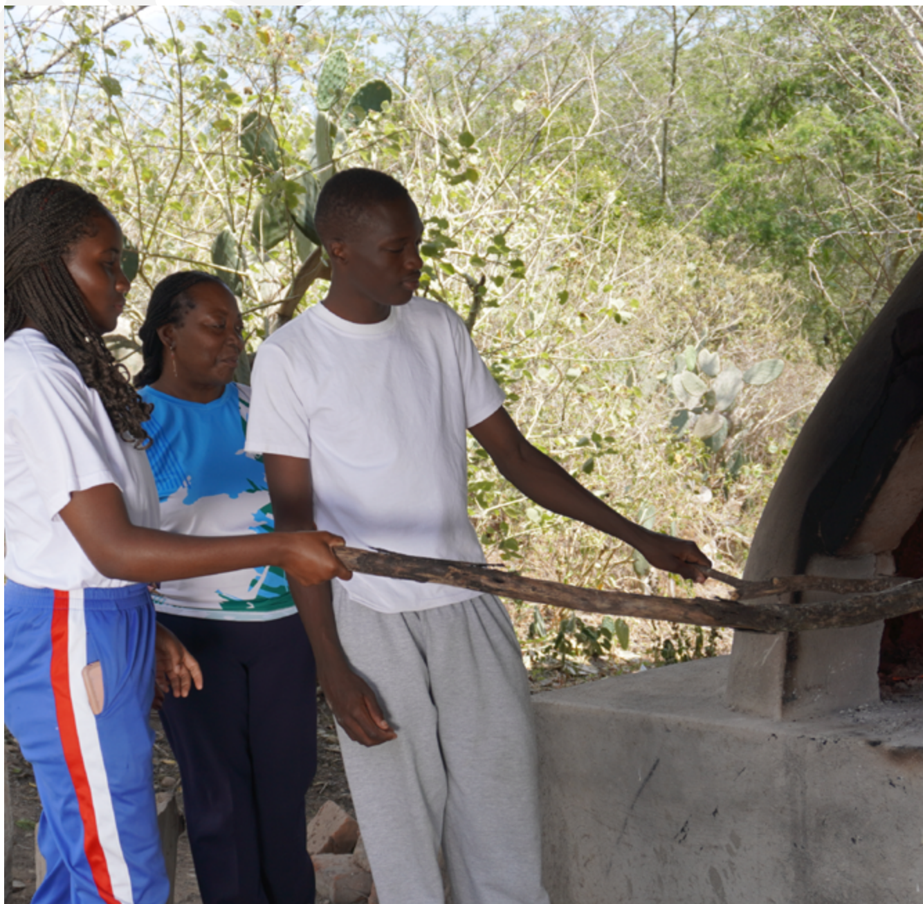
Rectora y estudiantes, Unidad Educativa Guardiana de los Saberes 19 de Noviembre, parroquia La Concepción, cantón Mira, provincia del Carchi.