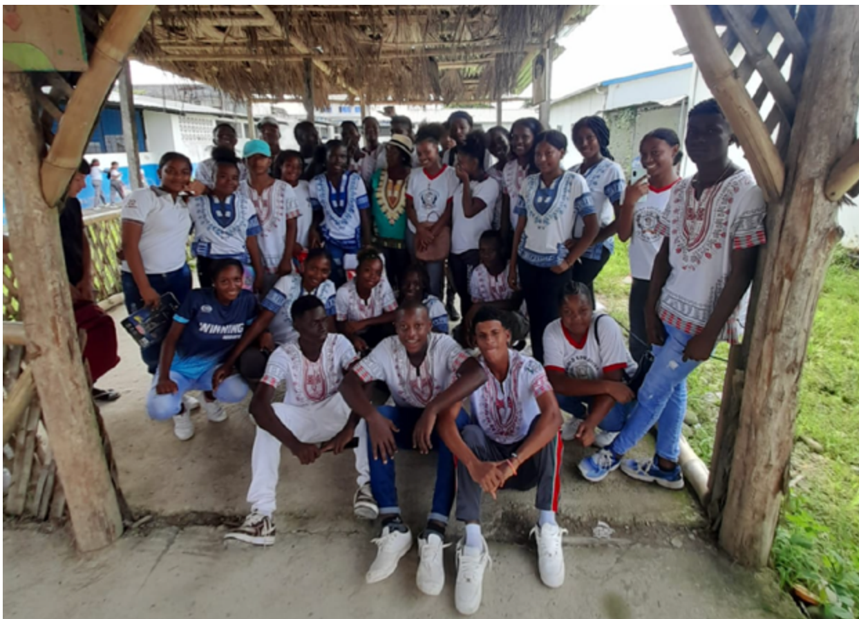
Estudiantes de la Unidad Educativa 20 de Marzo, cantón San Lorenzo – provincia de Esmeraldas.