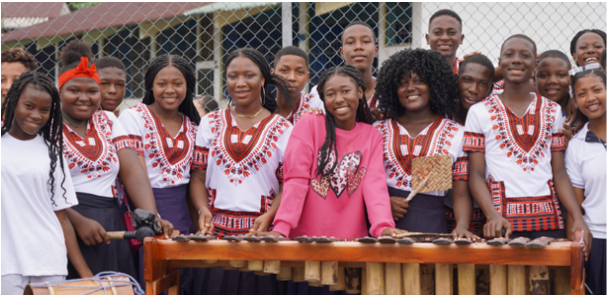
Estudiantes de la Unidad Gonzalo S Córdova, parroquia Timbiré, cantón Eloy Alfaro – provincia de Esmeraldas.

¿Qué son las Unidades Educativas Guardianas de los Saberes, del pueblo afroecuatoriano?