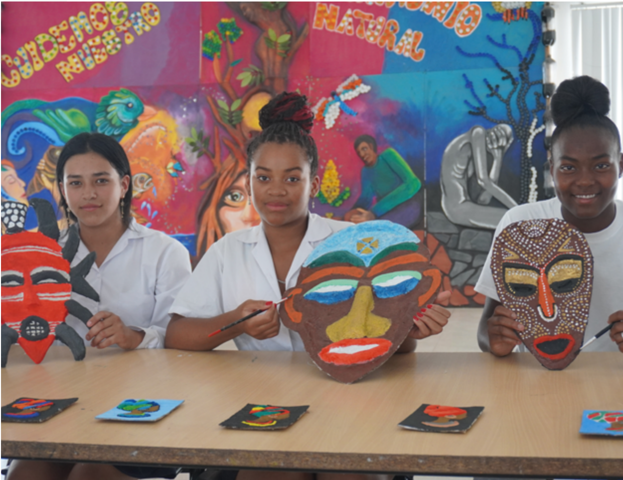
Estudiantes de la Unidad Educativa Guardianas de los Saberes San Gabriel de Piquiucho, cantón Bolívar – provincia de Carchi.